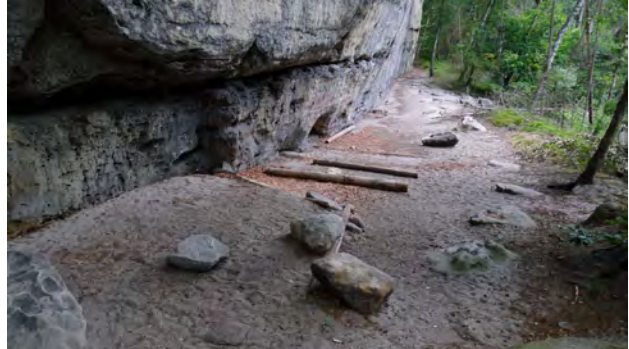
Negativ- und Positivbeispiel

Von der NPV bzw. vom Bund für Umwelt und Naturschutz Deutschland (BUND) wurden verschiedene Methoden wie Geräuschpegelmessungen, Lichtschranken und Vegetationskartierungen entlang von Transekten vorgeschlagen. Inwiefern diese Messmethoden in die Evaluierung der temporären Sperrungen einbezogen werden können, ist noch nicht geklärt. Für uns ist es ein Problem, wenn die Evaluierungskriterien erst im laufenden Prozess definiert werden und man bereits ein Auge auf die Ergebnisse haben kann. Fehlende personelle und finanzielle Mittel erschweren zusätzlich durchaus sinnvolle Erhebungen oder Auswertungen. Die laufenden Gespräche dienen damit auch der Erkundung dessen, was überhaupt leistbar ist und welche Aussagen (nicht) aus den Beobachtungen abgeleitet werden können.